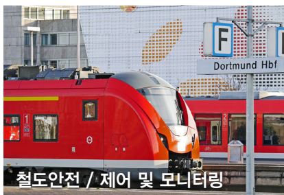
철도안전 / 제어 및 모니터링

재난 상황에서도 통화를 지속 할 수 있는 단말 기술 재난 상황을 신속하게 효과적으로 전파할 수 있는 단말기술