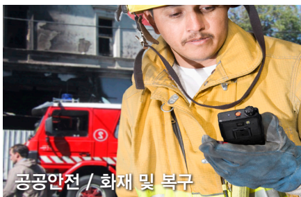
공공안전 / 화재 및 복구

재난 상황에서도 통화를 지속 할 수 있는 단말 기술 재난 상황을 신속하게 효과적으로 전파할 수 있는 단말기술