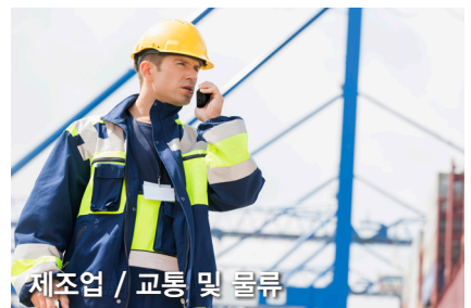
제조업 / 교통 및 물류

효율적으로 열차를 제어하고 모니터링할 수 있는 단말 기술 장애 발생 시 신속하게 열차를 유지보수할 수 있는 단말 기술